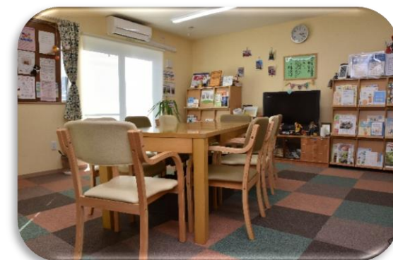
武蔵野市桜堤にある暮らしの保健室 「i k i なまちかど保健室みゅうちゅある」